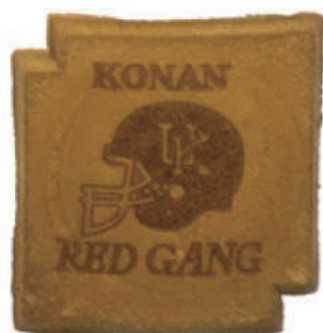
アメリカンフットボール部