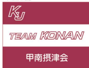
4-1-5. 甲南摂津会 (日本語表記)