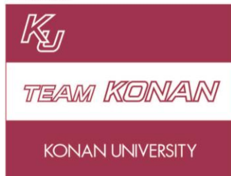
4-1-2. 甲南大学 (英語表記)