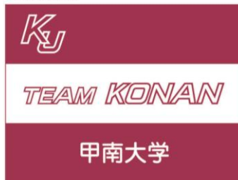
4-1-1. 甲南大学 (日本語表記)